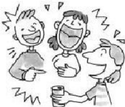
パーティーでの大声や大音量の音楽