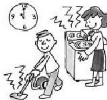
掃除機や洗濯機の音