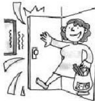
ドアを強く開け閉めした際の音