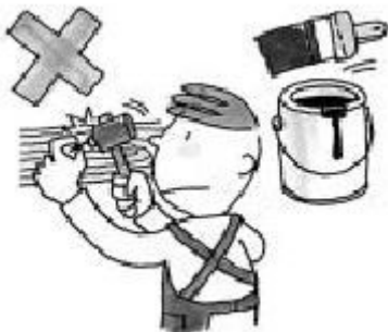
部屋に釘を打ったり、ペンキを塗ること

家主の許可をもらわないで、改造や模様替え、家族以外の人と一緒に住ませるはいけません。もちろん、家の一部または全部をほかの人に貸してもいけません。