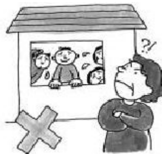
別の人に部屋を貸すこと